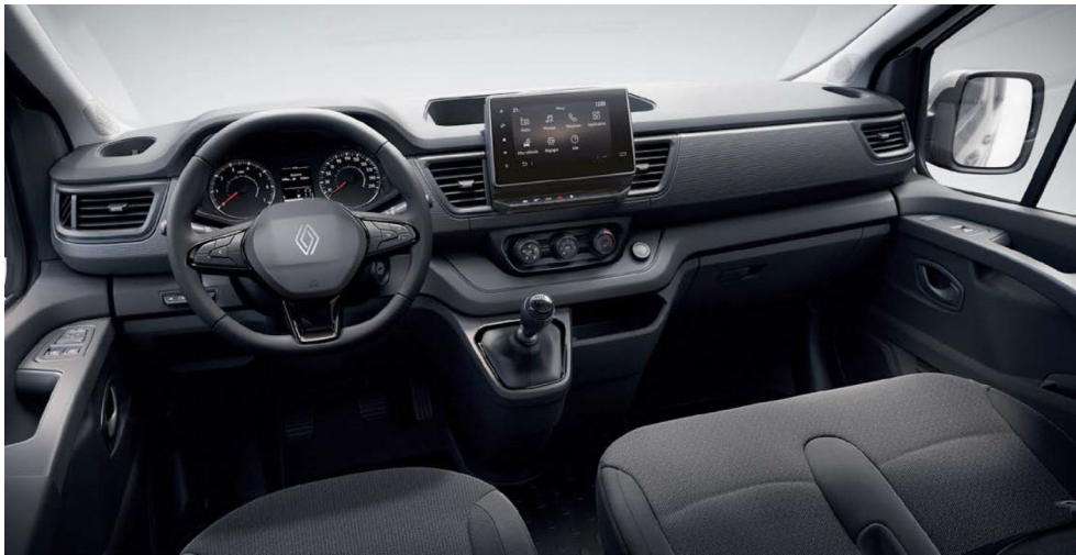
Πίνακας οργάνων οδηγού με οθόνη TFT 3.5" & σύστημα πολυμέσων με ψηφιακή οθόνη 8"