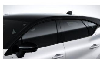
Οροφή σε Μαύρο χρώμα

Στις φωτογραφίες ενδέχεται να απεικονίζονται εκδόσεις με προαιρετικό εξοπλισμό