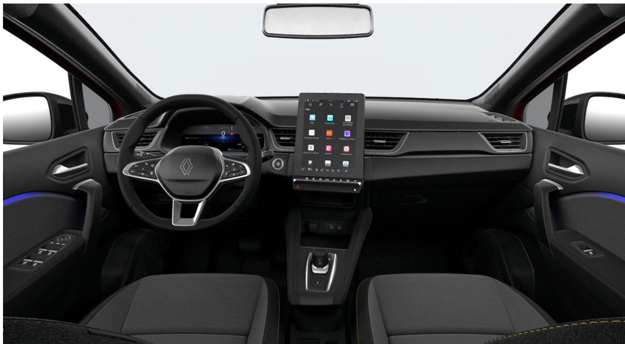
Ψηφιακός πίνακας οργάνων & Σύστημα πολυμέσων openR link 10,4"