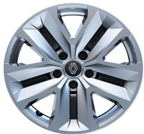
Τροχοί 17" "nymphea" & ελαστικά 215/60 R17