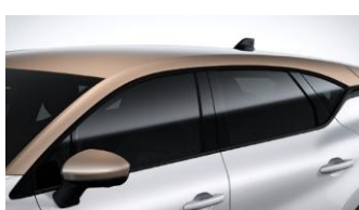
Οροφή σε Μπεζ χρώμα