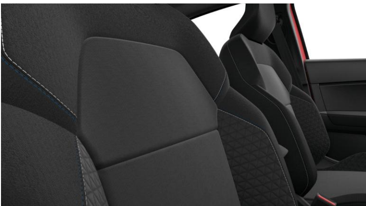
Υφασμάτινες επενδύσεις εμπρός καθισμάτων σε μαύρο & γκρι χρώμα, με τερκουάζ διακοσμητικές ραφές