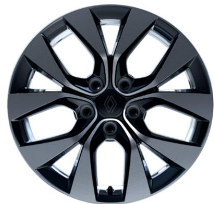
Ζάντες αλουμινίου 17" "eridis" & ελαστικά 215/60 R17