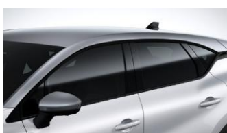
Οροφή σε Γκρι χρώμα