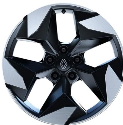
Ζάντες αλουμινίου 18" "black hole" & ελαστικά 215/55 R18