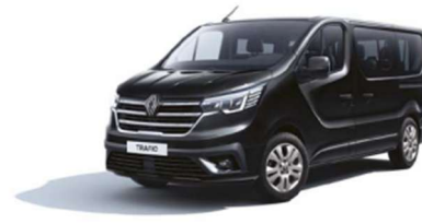
Μαύρο Midnight (2)