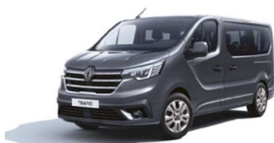
Γκρι Comet (2)