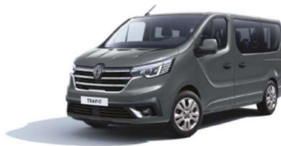
Γκρι Urban (2)