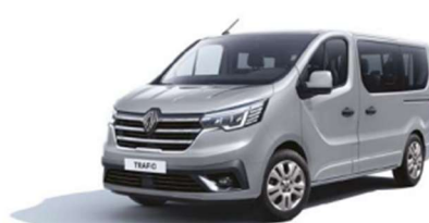
Γκρι Highland (2)