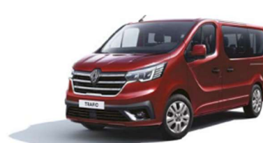
Κόκκινο Carmine (2)