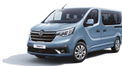
Μπλε Cumulus (2)