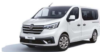
Λευκό Glacier (1)