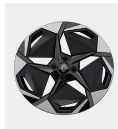
Ζάντες αλουμινίου 18" "rhythmic"