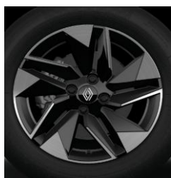
Ζάντες αλουμινίου 16" "dynamo"