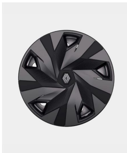
Τροχοί 16" "synchro" με δίχρωμο κάλυμα & ελαστικά 195/60 R16