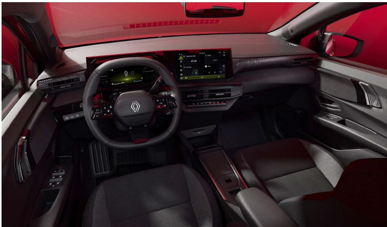
Ψηφιακός πίνακας οργάνων 7" & σύστημα πολυμέσων openR link 10,1"