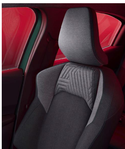
Υφασμάτινες επενδύσεις καθισμάτων σε μαύρο-γκρι χρώμα, με τιρκουάζ διακοσμητικές ραφές