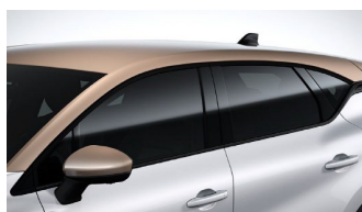
Οροφή σε Μπεζ χρώμα