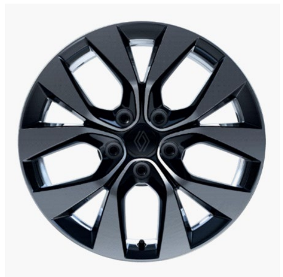
Ζάντες 17" αλουμινίου "eridis" & ελαστικά 215/60 R17