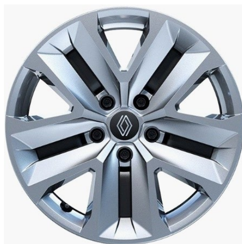
Τροχοί 17" "ημψηφια" & ελαστικά 215/60 R17