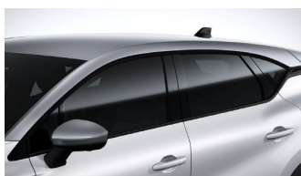
Οροφή σε Γκρι χρώμα