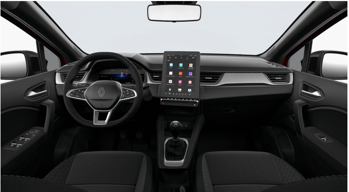
Ψηφιακός πίνακας οργάνων 7" & Σύστημα πολυμέσων openR link με οθόνη 10,4"